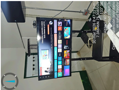
TRABAJO PLACA TV-30/03/2026-20:48:10