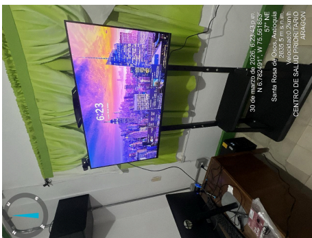
TRABAJO PLACA TV-2026//0330-18:23:58