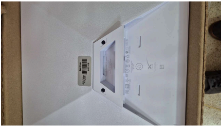
ESTADO STARLINK MINI-10/04/2026-16:54:14