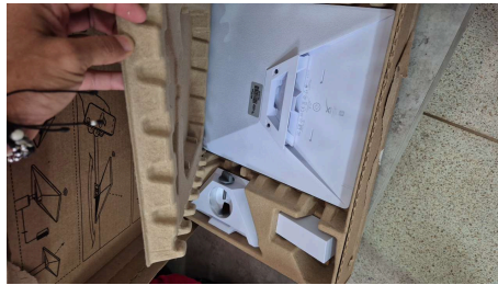
TRABAJO STARLINK MINI-10/04/2026-16:55:17