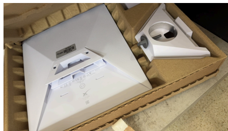
TRABAJO STARLINK MINI-09/04/2026-20:12:34