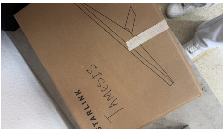
ESTADO STARLINK MINI-09/04/2026-20:11:27