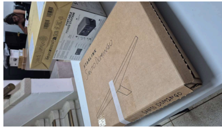
TRABAJO STARLINK MINI-19/03/2026-20:37:32