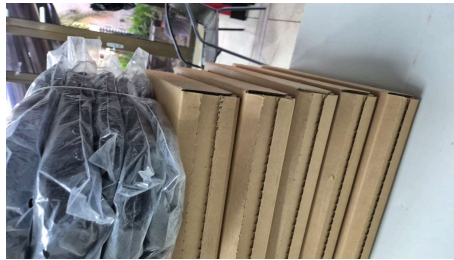
TRABAJO STARLINK MINI-19/03/2026-14:48:46