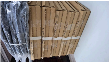
ESTADO STARLINK MINI-19/03/2026-14:48:25