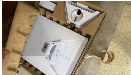
TRABAJO STARLINK MINI-07/04/2026-14:33:53