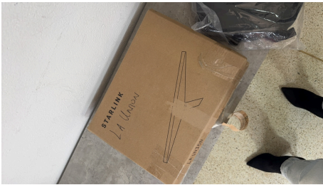
ESTADO STARLINK MINI-07/04/2026-14:32:42