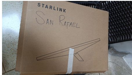
TRABAJO STARLINK MINI-18/03/2026-21:00:58