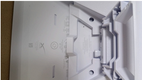
ESTADO STARLINK MINI-18/03/2026-21:00:06