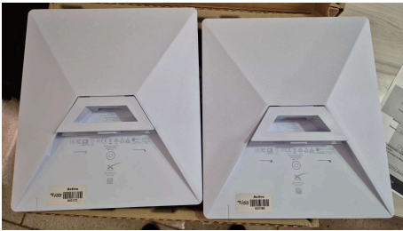
ESTADO STARLINK MINI-28/04/2026-15:19:00