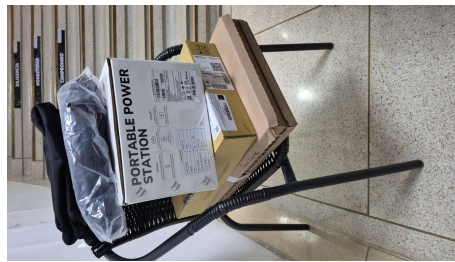
TRABAJO STARLINK MINI-19/03/2026-22:08:01