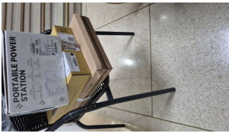
ESTADO STARLINK MINI-19/03/2026-22:07:23