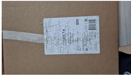
TRABAJO STARLINK MINI-24/03/2026-16:27:55