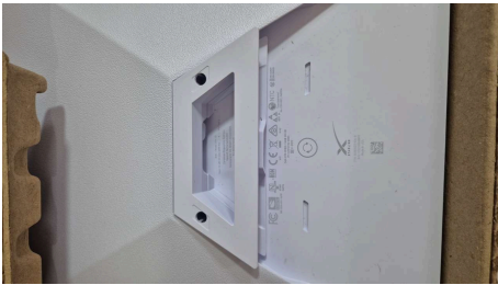
ESTADO STARLINK MINI-24/03/2026-16:26:54