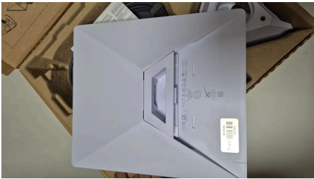
ESTADO STARLINK MINI-18/03/2026-19:24:58