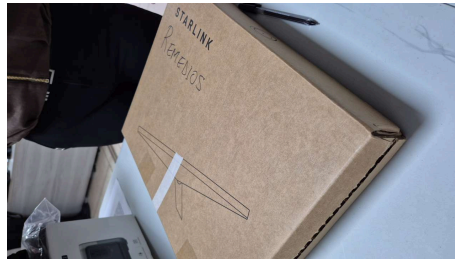
TRABAJO STARLINK MINI-18/03/2026-19:26:22