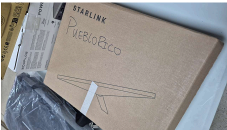
ESTADO STARLINK MINI-19/03/2026-20:17:10