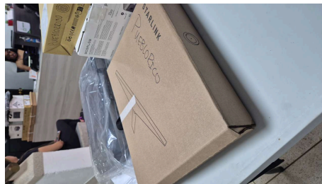
TRABAJO STARLINK MINI-19/03/2026-20:18:14