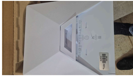
TRABAJO STARLINK MINI-14/04/2026-14:38:06