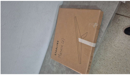
ESTADO STARLINK MINI-14/04/2026-14:37:02