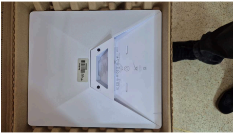
ESTADO STARLINK MINI-26/03/2026-15:43:32