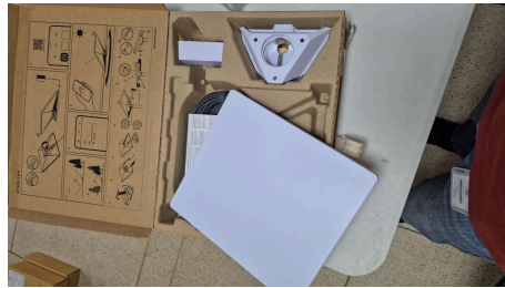
TRABAJO STARLINK MINI-18/03/2026-14:49:13