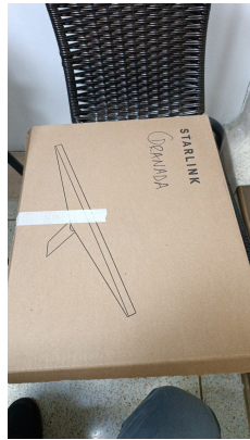
TRABAJO STARLINK MINI-18/03/2026-20:43:19