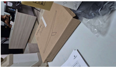
ESTADO STARLINK MINI-19/03/2026-21:52:36