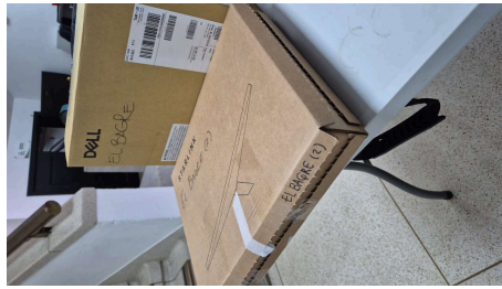
TRABAJO STARLINK MINI-19/03/2026-15:32:47