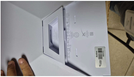
ESTADO STARLINK MINI-19/03/2026-15:32:02