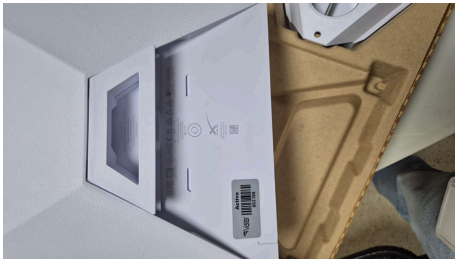
ESTADO STARLINK MINI-19/03/2026-19:42:56