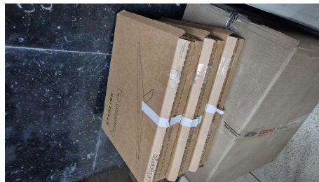
TRABAJO STARLINK MINI-28/04/2026-20:15:13