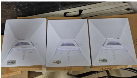
ESTADO STARLINK MINI-28/04/2026-20:12:02