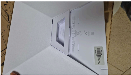
ESTADO STARLINK MINI-19/03/2026-15:44:07