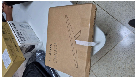
TRABAJO STARLINK MINI-19/03/2026-15:44:24