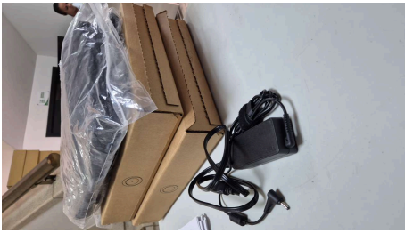
ESTADO STARLINK MINI-18/03/2026-16:53:05