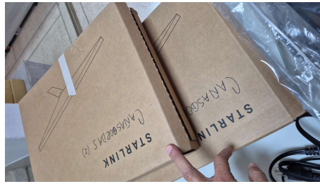
TRABAJO STARLINK MINI-18/03/2026-16:53:28