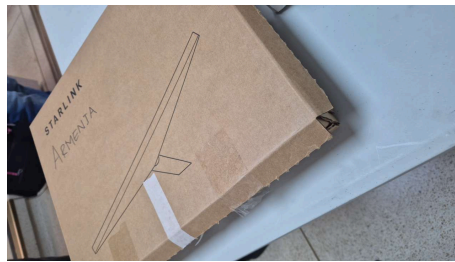
TRABAJO STARLINK MINI-19/03/2026-19:09:33