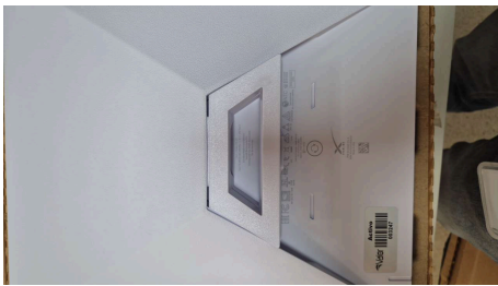
ESTADO STARLINK MINI-19/03/2026-19:08:47