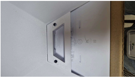
ESTADO STARLINK MINI-19/03/2026-16:27:09