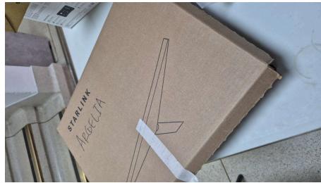
TRABAJO STARLINK MINI-19/03/2026-16:27:22