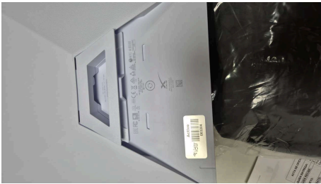
ESTADO STARLINK MINI-18/03/2026-20:42:03