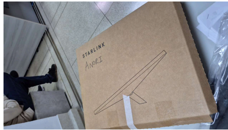
TRABAJO STARLINK MINI-18/03/2026-20:43:16