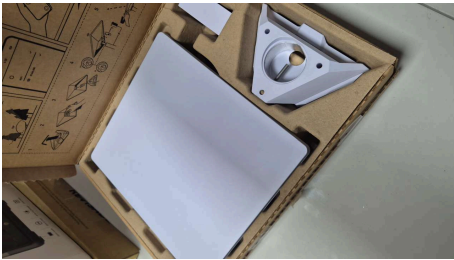
ESTADO STARLINK MINI-19/03/2026-19:53:59