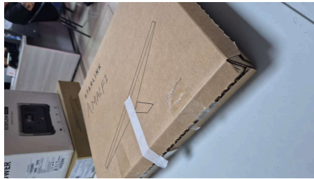
TRABAJO STARLINK MINI-19/03/2026-19:54:39