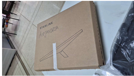
TRABAJO STARLINK MINI-18/03/2026-20:02:04