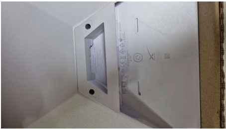
ESTADO STARLINK MINI-18/03/2026-20:01:24