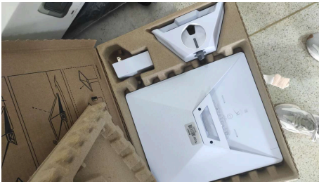
ESTADO STARLINK MINI-25/03/2026-14:31:19