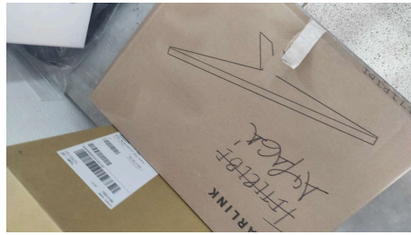
TRABAJO STARLINK MINI-25/03/2026-14:32:09