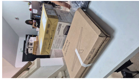
TRABAJO STARLINK MINI-19/03/2026-20:30:01