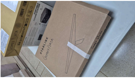
ESTADO STARLINK MINI-19/03/2026-20:29:15